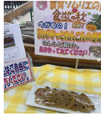
10月：れんこん・かぼちゃレシピ