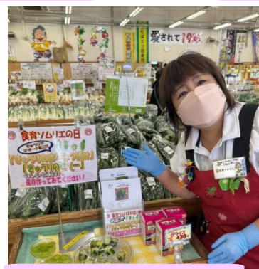
6月:きゅうりレシピ