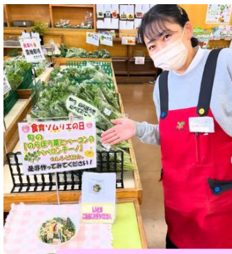
3月:のらぼう菜レシピ