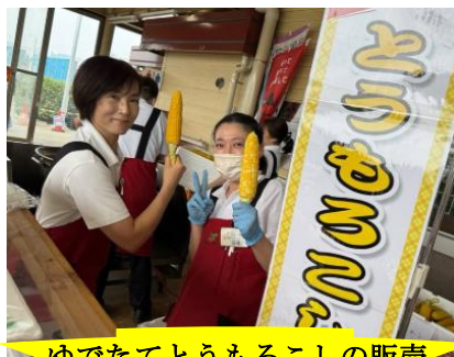
ゆでたてとうもろこしの販売