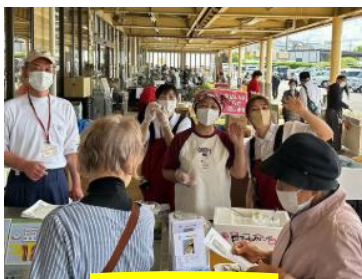
永澤豆腐さんコラボ企画