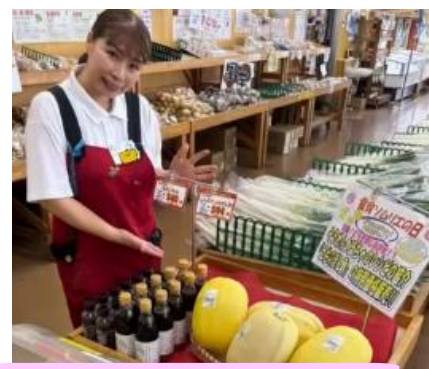
8月:そうめんかぼちゃレシピ