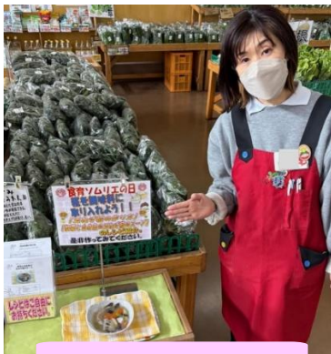
1月:玉ねぎ麺レシピ