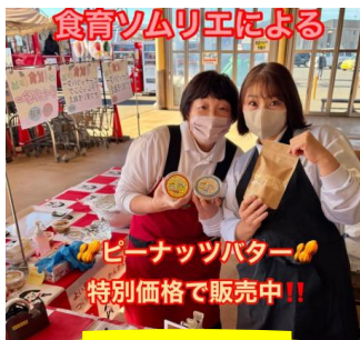
ピーナッツバター販売