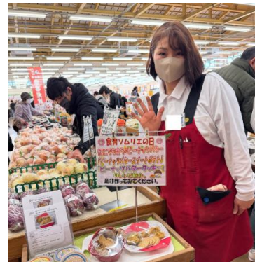
2月:ピーナッツバターレシピ