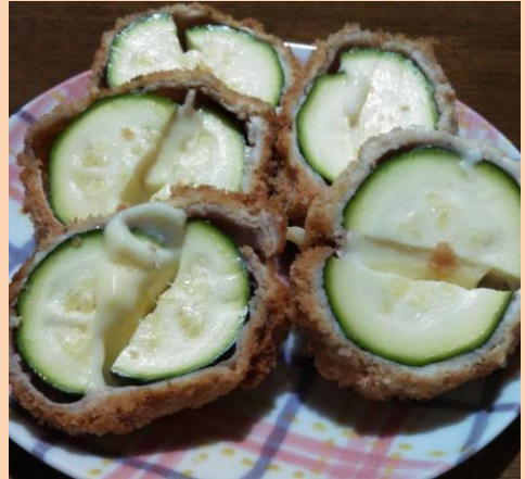
ズッキーニの肉巻きフライ